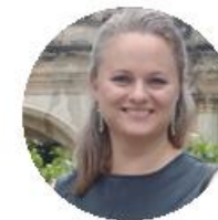
Caitlin Scott Friendship Bridge