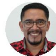
Víctor Contreras Friendship Bridge